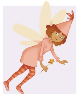
Lili la fée