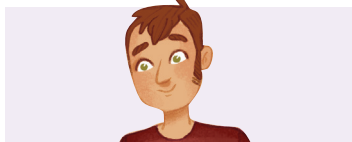
le papa d'Émilienne